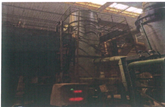
京唐公司酸轧作业区轧机区域环境提升项目

2025年，京唐公司锚定目标，推进实施酸轧作业区轧机区域环境提升项目等多项环保深度治理项目，全流程污染物管控持续提升环保绩效A级企业水平。